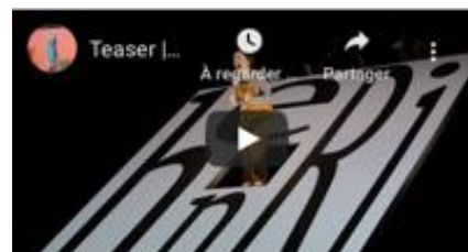
L'Enfant inouï (Jeune public) Musique de Laurent Cuniot Mise en scène Sylvain Maurice