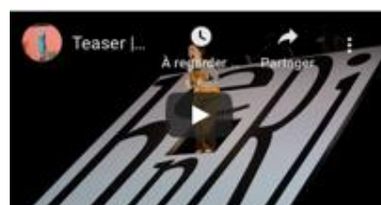
L'Enfant inouï (Jeune public) Musique de Laurent Cuniot Mise en scène Sylvain Maurice