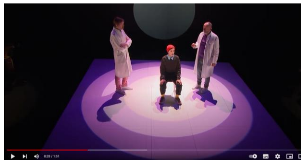
La Vallée de l'étonnement

Musique d'Alexandros Markeas Mise en scène Sylvain Maurice