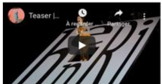
L'Enfant inouï Musique de Laurent Cuniot Mise en scène Sylvain Maurice