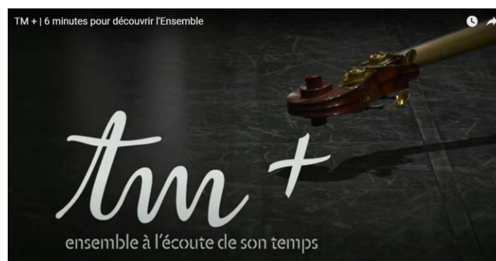
TM+ 6 minutes pour découvrir l'ensemble