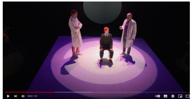
La Vallée de l'étonnement Musique d'Alexandros Markeas Mise en scène Sylvain Maurice