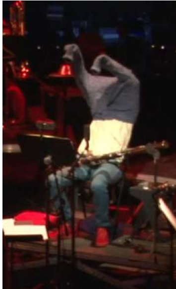
Le solo de pull