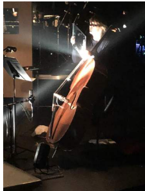
Le duo de miroirs contrebasse et violon