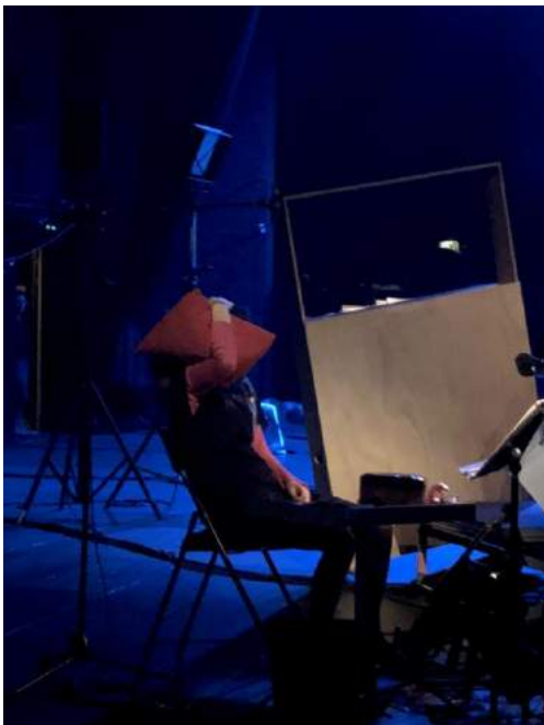
Nuit sur coussins rouges

LE MUSICIEN A SES PROPRES MOUVEMENTS QUI NOUS PLACENT DANS UNE SITUATION TRÈS LISIBLE : ON SAIT IMMÉDIATEMENT QUI SONT CES GENS SUR SCÈNE ET QUEL EST LEUR TRAVAIL. À PARTIR DE LÀ, IL EST POSSIBLE DE S'AMUSER À DÉTOURNER. DÉTOURNER LES GESTES, LE RAPPORT À L'INSTRUMENT, LA PRÉSENCE DE CHACUN... IL EST DIFFICILE D'ÉCOUTER UN CONCERT LES YEUX FERMÉS, PARCE QU'ON S'INTÉRESSE NÉCESSAIREMENT AUX GENS QUI SONT SUR LE PLATEAU. ON SCRUTE CHAQUE DÉTAIL, CHAQUE OBJET - LA COULEUR DES CHEVEUX DE CHACUN, LE CHOIX D'UNE BROCHE ÉPINGLEE SUR UNE VESTE... TOUS CES PETITS DÉTAILS QUI FONT L'HUMANITÉ DES ARTISTES PRÉSENTS SUR LE PLATEAU. LA MISE EN SCÈNE DÉVELOPPE CES ESPACES TOUT À LA FOIS POÉTIQUES ET IMAGINAIRES. "