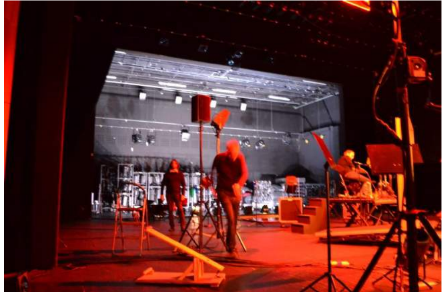
La course du percussionniste qui oublie ses clés